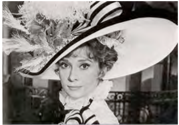
イライザことオードリー・ヘップバーン (Audrey Hepburn, 1929-1993) こと、ピグマリオンこと…… ELISA は魅惑あるゆえに異性を惹き付ける存在だ (Lover-sorbent actor....)