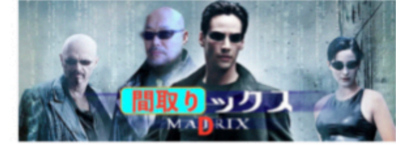
02◎オイラはマトリクス主義者