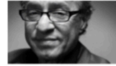
01◎シンギュラリティ狂想曲