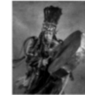
05◎ヒュームとオーティズム