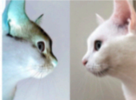
10◎多元的リアリティ Ver 2.0